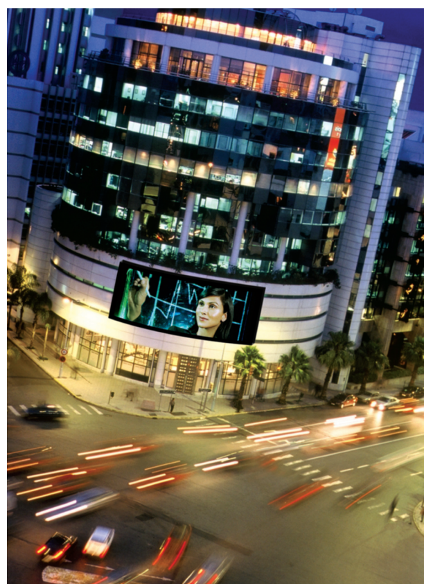
Le siège de la BMCE Bank à Casablanca.

Ces deux opérations constituent une réelle avancée dans la mise en place d'une stratégie de banque universelle à l'international, dont les assurances ne sont pas exclues : le