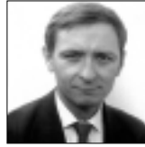
Avec la participation exceptionnelle de Thierry Bonneau Agrégé des facultés de droit Professeur à l'Université Panthéon-Assas (Paris 2)